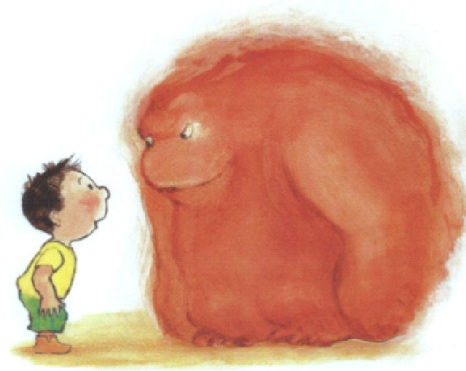
Immagini estratte da D'Allancé, M., Che rabbia! , Babalibri (versione in simboli a cura di Enza Crivelli)